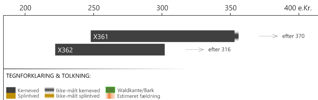
Figur 1: Dateringsdiagram for VKH 7969 etape III, Raskvej, Åle. Undersøgelsens dateringer placeret på en tidsskala med angivelse af årringssekvensernes længde og konstateret kerneved, splintved, waldkante osv. De beregnede fældningstidspunkter for de undersøgte prøver er noteret i forlængelse af hver prøves årringssekvens. Fældningstidspunkterne er beregnet vha. splintstatistikker (se evt. Metodebeskrivelse i rapportens bilag); for egetræ 20 [-5+10] årringe i splintved. For prøver med waldkante/bark er det absolutte fældningstidspunkt noteret.

De daterede prøvers tidsmæssige placering kan ses i dateringsdiagrammet (Figur 1). Statistiske værdier vedrørende dateringen kan ses i Tabel B3 i bilag. Prøverne er dateret ved hjælp af referencemateriale fra Danmark. Visse kurver er stillet til rådighed af Dendrokronologisk Laboratorium på Nationalmuseet og A. Daly fra dendro.dk. Information om prøven og de udarbejdede undersøgelser kan findes i kataloget i rapportens bilag (Tabel B2).