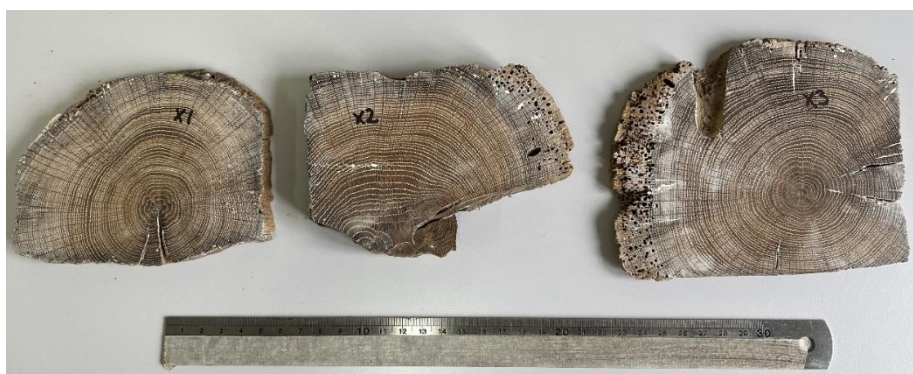
Figur B 1: De tre træprøver.

Tabel B3: Absolut datering. Kolonner til højre angiver t-værdier for krydsdatering af undersøgelsens middelkurver/årringskurver med grund- og referencekurver for Danmark/Skandinavien. Tabellens nederste rækker viser de benyttede referencekurver. Eventuelle kilder til referencekurver er angivet i referencebeskrivelsen (f.eks. NM = Nationalmuseet).